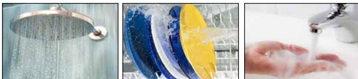
Tabla de Rendimiento