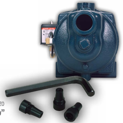
Revolucionario Sistema de Reemplazo Boquillas Jet “Cambio-Rápido”

* Noryl® es una marca registrada de General Electric Company